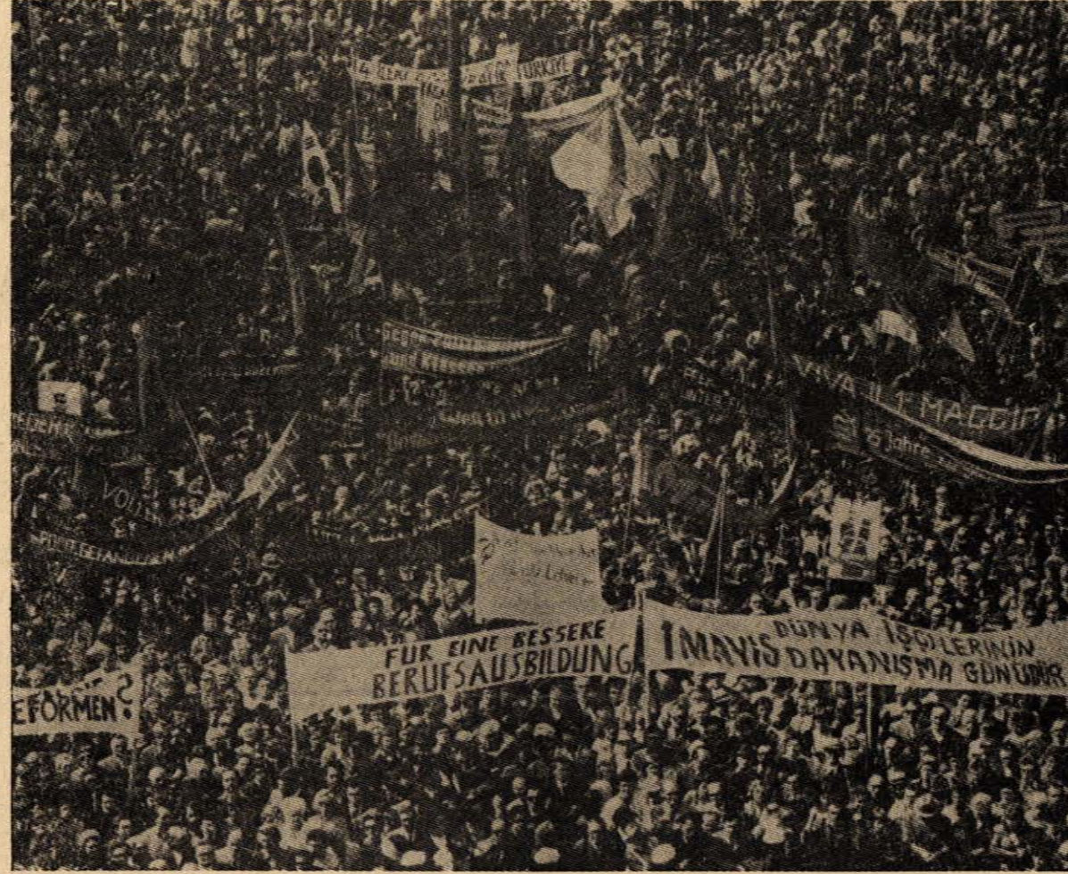
Federal Almanya'da bütün göçmen işçiler, Alman işçilerinin yanında 1 MAYIS'ı kutlama törenlerine katıldılar.

1924 yılında 1 Mayıs, Ankara, Adapazarı ve İzmir'li işçiler tarafından canlı bir şekilde kutlanmıştır. İstanbul'da ise 1 Mayıs'ın kutlanması hükümet tarafından engellenmiştir. 1 Mayıs'ı kutla-