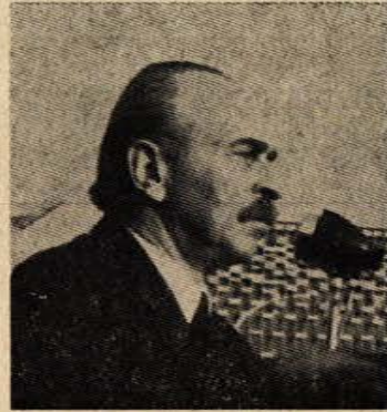
SP Genel Başkanı M. Ali Aybar.

Bu bakımdan 1 Mayıs'ın tarihsel önemi geleneksel ve pratik olduğu kadar, ona bu niteliği kazandıran esas anlamının bilimsel karakteridir.