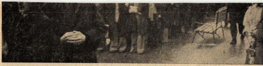
17 Nisan 1976 Cumartesi günü İstanbul Barosu'na kayıtlı Avukatların düzenledikleri «KAN DÖKMEYE SON — HUKUKA SAYGI» yürüyüşünden.

Cevap : Diğer fabrikalardan grev yerimize gelen arkadaşlar bize güç katıyor. Gerçekten örnek dayanışma gösteriyorlar. İŞÇİ DAVASI gazetesi vasıtasıyla bütün işçi arkadaşlara selam ederiz.