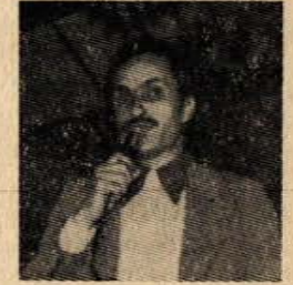
Hürcam - İş Sendikası Genel Başkanı Ali Şahin.

2 — Ülkemizde işçi sınıfı 1 Mayıs işçi bayramını bundan önce de kutlamıştır. Örneğin, 1921 yılında İstanbul'da Saraçhanebaşı'nda toplanan işçiler, Hürriyet-i Ebediyye Tepesine kadar yürüyüş yaptılar. Ve işçi sınıfımızın istemlerini o tarihlerde bile binlerce işçi haykırdı ve İstanbul'un sokaklarını «BÜTÜN ÜLKELERİN İŞÇİLERİ, BİRLEŞİNİZ» sloganı ile doldurdular. Sermaye sınıfı işçi sınıfımızın 1 Mayıs'ı kutlamaması ve uluslararası işçi sınıfı ile kaynaşmasını ön-