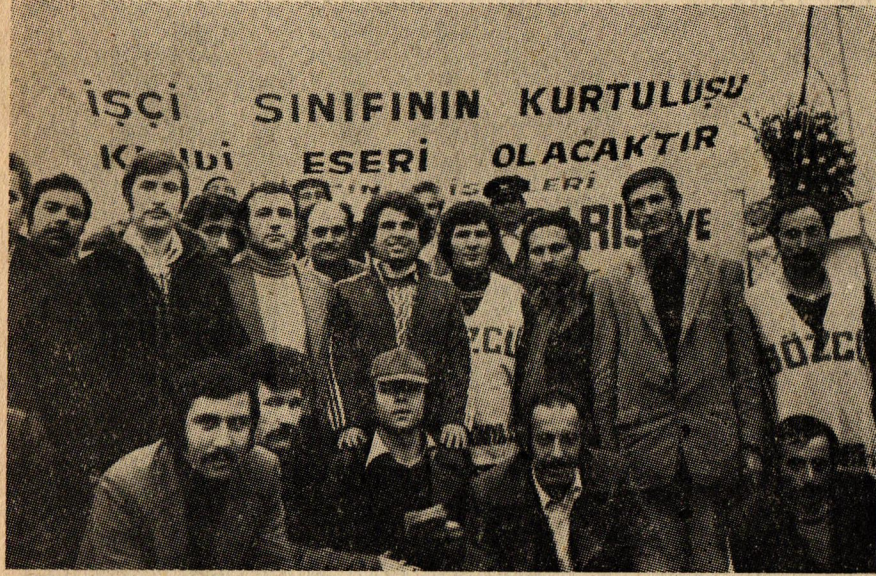
Petrol Kimya iş üyesi Marşal işçilerinin örnek grevi başarıyla devam ediyor.