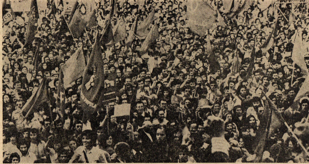
Portekiz işçi sınıfı 1 MAYIS'ı kutluyor.

* BÜTÜN TÜRKİYE'DE 1 MAYIS İŞÇİ BAYRAMI OLARAK KUTLANMALIDIR